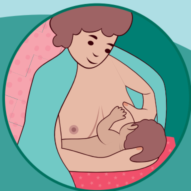
Posizione a culla modificata