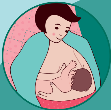
Posizione a culla